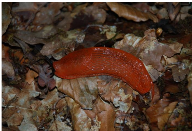
Röd skogssnigel, Arion rufus .