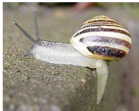
Trädgårdssnäcka