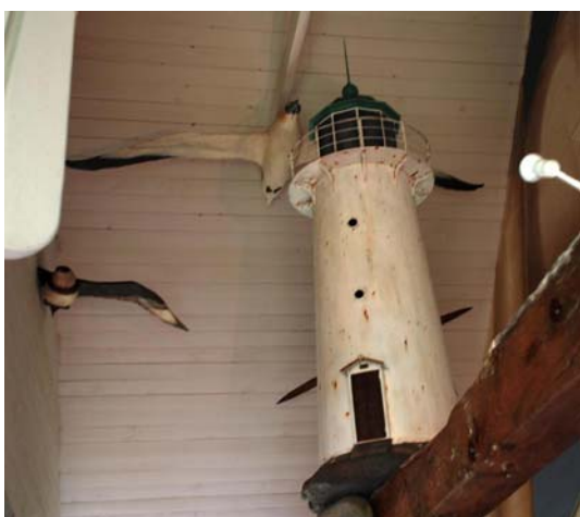
Tittar man in på Väderö museet kan man se en modell av Hallands Väderö fyr omgiven av havsfåglar.