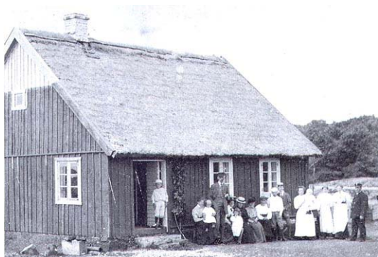
Lotsstugan med familjen Paulus Romare och vänner ca 1910.