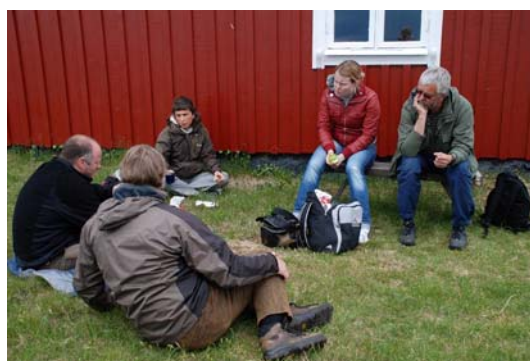
Museidelegation från Länsmuseum i Kristianstad på inspektion och översyn 2009.