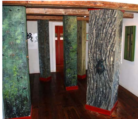
Pelarna i pelarsalen har luckor som kan öppnas. Bakom dem finns bilder från olika platser på ön. Bilderna lysas upp inifrån av energisnåla lampor när luckan öppnas. Batterier, som driver lamporna, laddas med solceller utanför stugan.