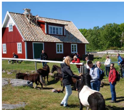
Besökare hundra år senare.

Halmtaket byttes mot gult taktegel 1951 då vinden också inreddes och fick takkupa. Det vita triangelmärket på södra gavelspetsen bildar tillsammans med ett vitt kummel (sjömärke) på Yttre Käften en enslinje för båtar på väg till och från Kappelhamn.