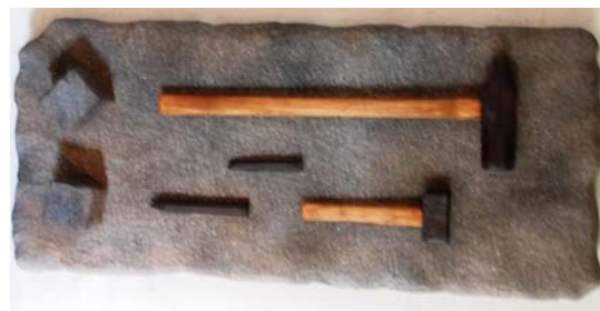
Äldre handredskap för stenhugning visas i öppna spisen och redskap från skogsavverkning på en vägg.