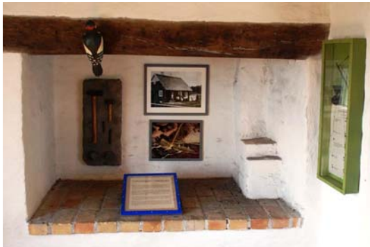
Den öppna spisen i förstugan har blivit monter.