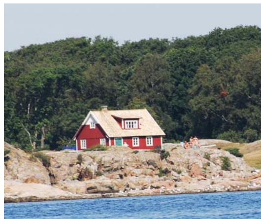
Väderö museet, tidigare kallad Stenhuggarhuset och Lotsstugan.